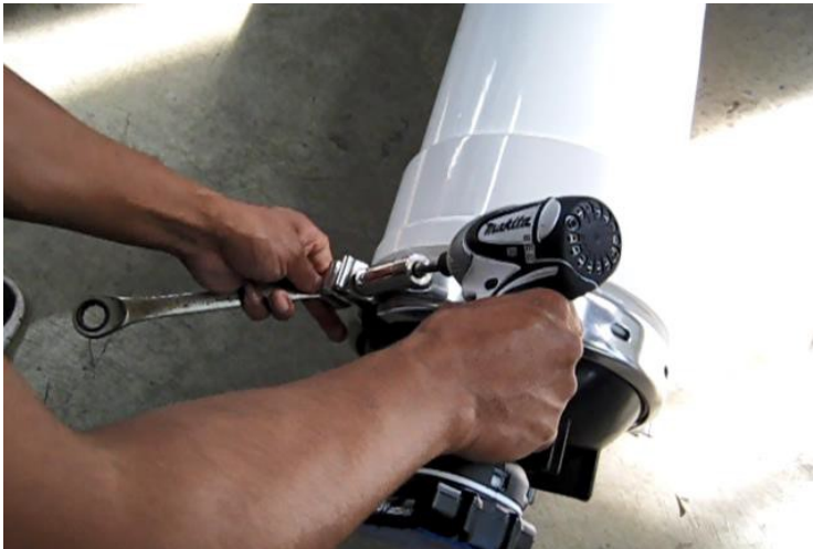
图 2 松开螺丝