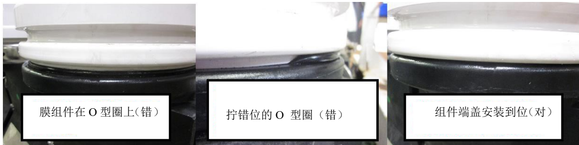
图 8 安装示例