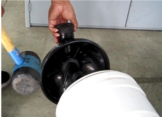
图 3 橡胶锤敲动后，端盖脱离组件

注意：不能使用任何金属工具，因为外壳和端盖都由塑料制成，金属工具会对密封表面造成不可恢复的损坏。