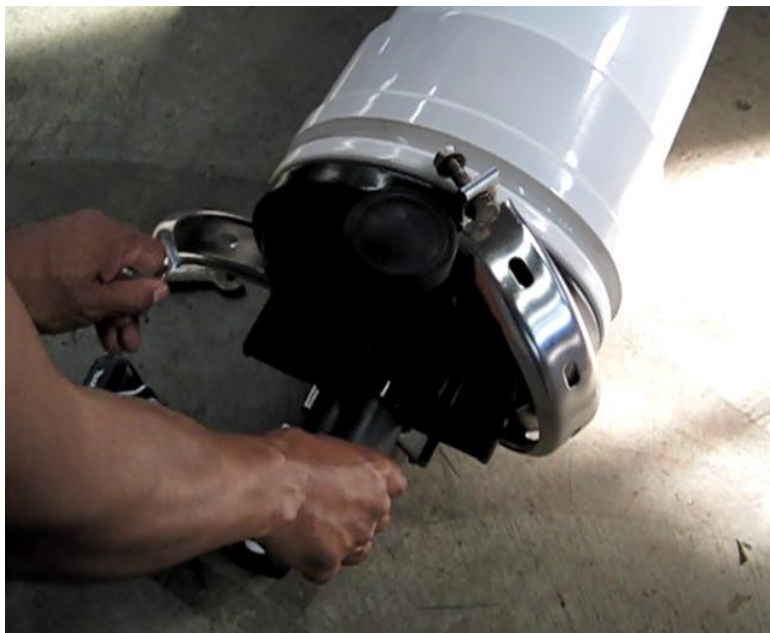
图 3 拆下端盖夹环