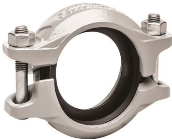
图 1 快装接头示例