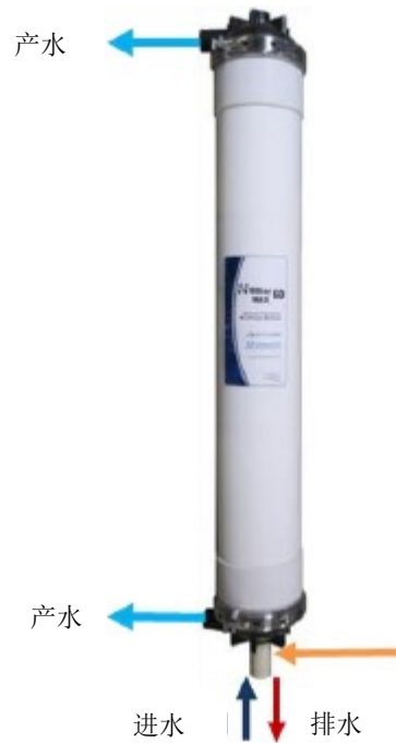
图 7 对齐产水管口