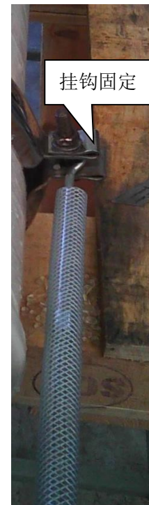
图 3 挂钩在卡箍上的连接点