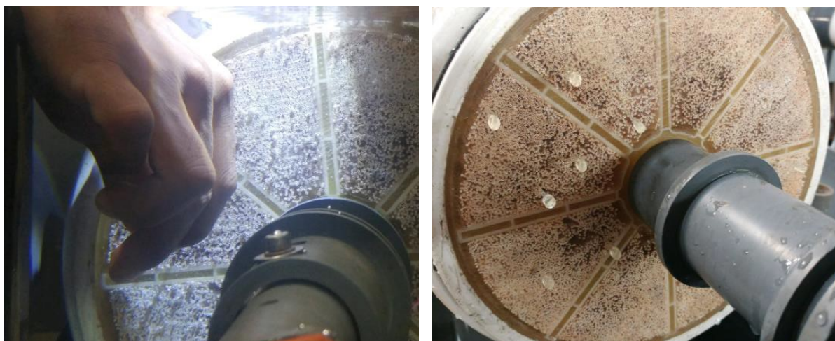
图 5 标记断位置