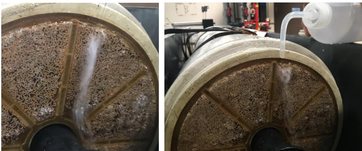
图 4 采用喷水瓶时气流示例